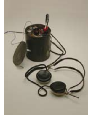
Radio-ontvanger vermomd als conservenblik

Na het illegaal beluisteren van Radio Oranje werd het blik weggezet in de voorraadkast. Wel met de afgesloten kant boven, zodat het niet opviel tussen