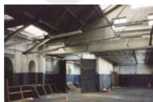
Een leeg Gebouw Plancius, vóór de verbouwing tot Verzetsmuseum (1999).

de samenhang tussen vorm en inhoud één van de meest geslaagde ooit, omdat vormgever Jowa het voor elkaar kreeg om over de smalle vrouwengalerij in de Lekstraat een rondgang te creëren waar bezoekers de zuidelijk route van een Engelandvaarder echt konden volgen."