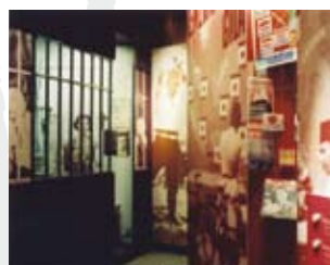
In 2005 breidde het museum uit met een speciale afdeling over Nederlands-Indie.