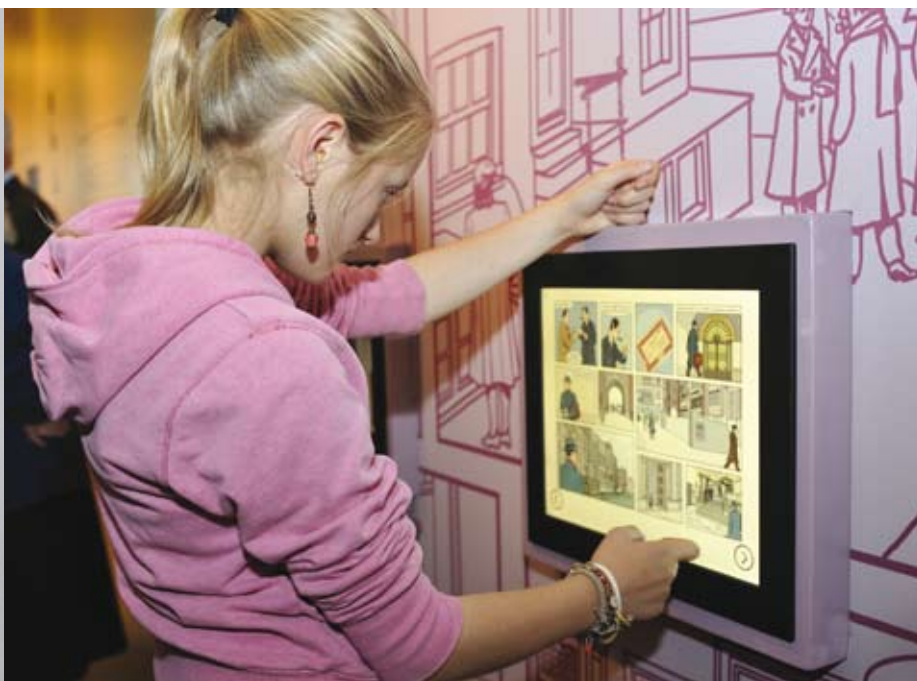
Meisje bij een multimediale opstelling in de expositie Wally van Hall.